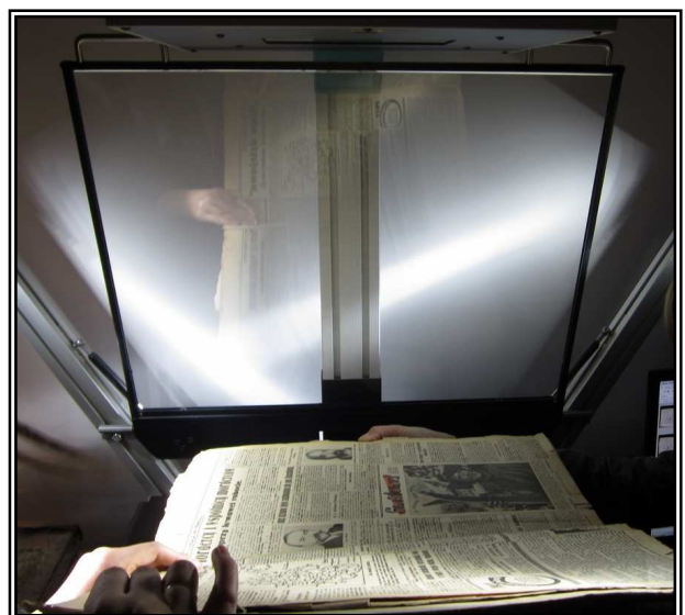
MBC, fot. Archiwum WBP w Krakowie