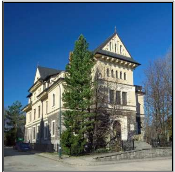
Muzeum Tatrzańskie, Gmach Główny