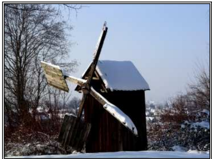
Wiatrak z Biczyc Górnych w skansenie w N. Sączu