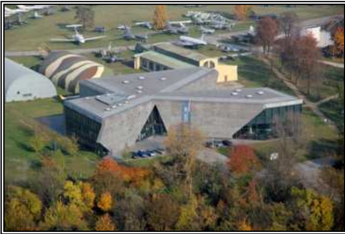
Lotniczy Park Kulturowy w Krakowie